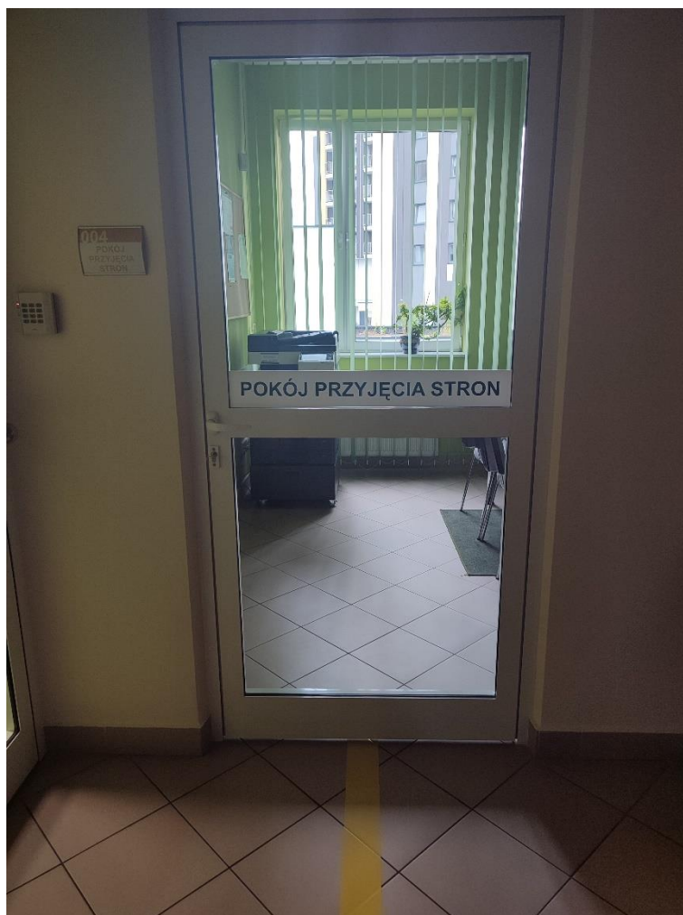
Zdjęcie 8: Pokój przyjęcia stron

Po wyjściu z windy na parterze osoba niepełnosprawna może skierować się do pokoju przyjęcia stron na co wskazuje kontrastująca taśma na podłodze. W pokoju tym można usiąść i poczekać na umówione spotkanie.