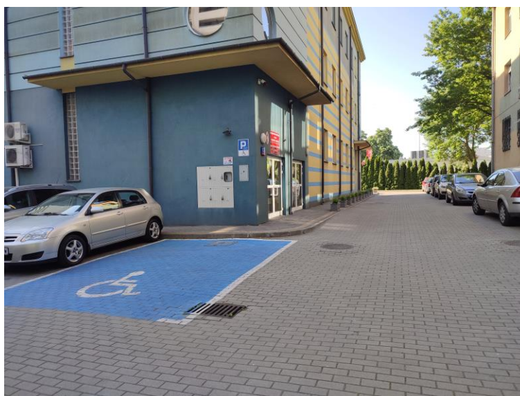
Zdjęcie 1: Parking i droga pożarowa

Budynek znajduje się w bezpośrednim sąsiedztwie budynku Wojewódzkiego Inspektoratu Weterynarii w odległości 10 m i składa się z trzech kondygnacji, jest podpiwniczony, wykonany w konstrukcji tradycyjnej ze szkieletem żelbetowym. Ściany zewnętrzne dwuwarstwowe wykonane z pustaków ceramicznych i styropianu a wewnętrzne ściany nośne z pustaków ceramicznych, Ścianki działowe wykonane z cegły kratówki. Stropy żelbetowe monolityczne. Dach w postaci łukowej z blach samonośnych trapezowych. Obiekt nie jest objęty strefą podlegającą Ochronie Zabytków. Dojazd odbywa się z drogi miejskiej.