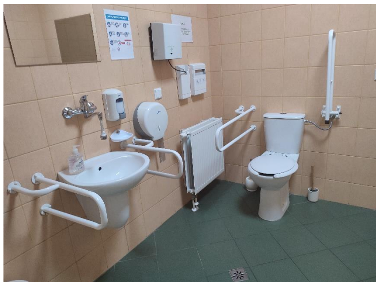
Zdjęcie 9: Toaleta dostosowana dla osób niepełnosprawnych

Na ścianie holu zawieszono wizualizację piętra z opisem pomieszczeń biurowych dla ułatwienia orientacji, w celu zlokalizowania miejsca docelowego.