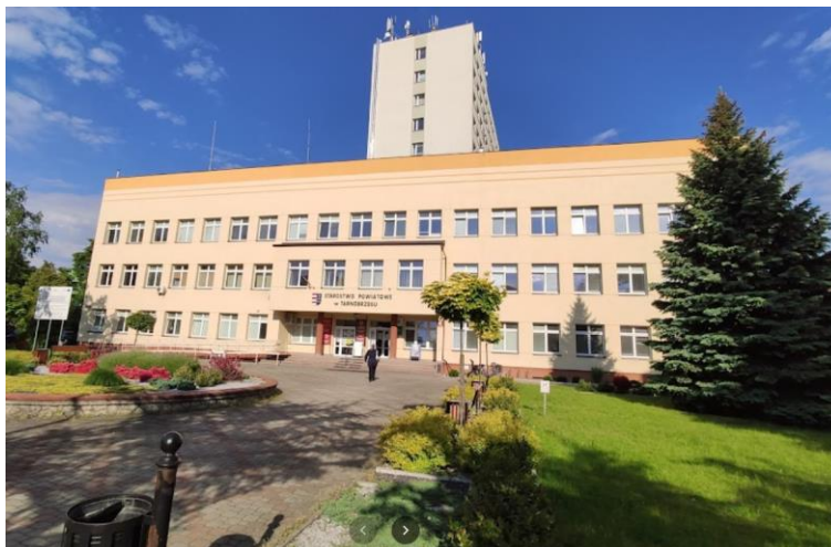
Zdjęcie 16: Budynek Podkarpackiego Urzędu Wojewódzkiego w Tarnobrzegu

Dodatkowo zamontowano linie kontrastowe na krawędziach pierwszych i ostatnich stopni schodów na każdej kondygnacji w budynku. Przy punkcie informacyjnym zostały zamontowane Beacons.