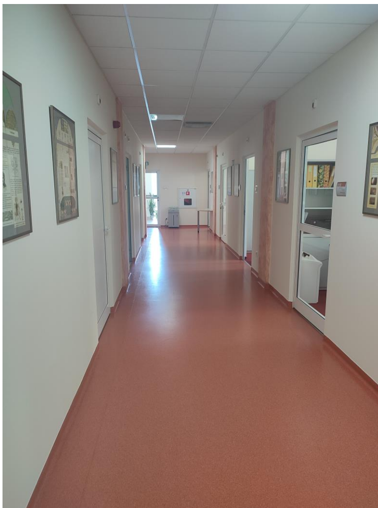
Zdjęcie 12: Korytarz wewnętrzny

Po przejściu do ciągu komunikacyjnego wewnętrznego, którego szerokość wynosi 220 cm zlokalizowane są biura po obu stronach korytarza. Podłoga wyraźnie kontrastuje się ze ścianami co znacznie ułatwia widoczność osobom niedowidzącym. Drzwi każdego pomieszczenia także się wyróżniają i mają szerokość 95 cm. Większość drzwi jest przeszklona, dzięki czemu korytarz oświetlony jest jasnym, naturalnym światłem, a w razie potrzeby wspomagany światłem sztucznym.