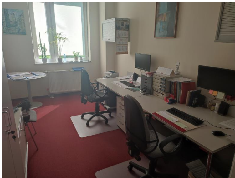
Zdjęcie 13: Pokój pracownika administracyjnego