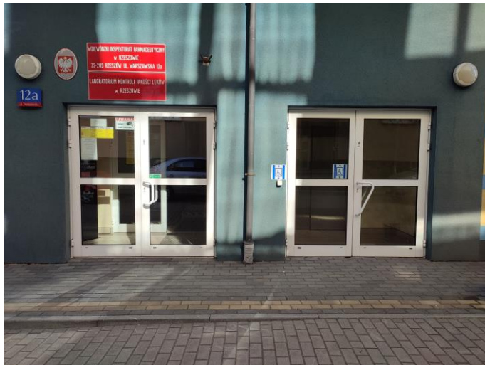
Zdjęcie 2: Wejście główne

Przy budynku istnieje droga pożarowa co w razie potrzeby znacznie ułatwia dostęp straży pożarnej. Przy głównym wejściu oznakowano specjalne miejsce parkingowe dla osoby niepełnosprawnej o wymiarach 3,6 m x 5 m.