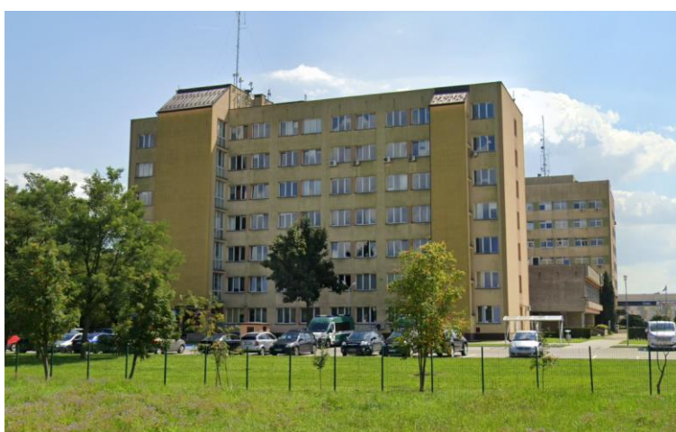
Zdjęcie 14: Budynek Podkarpackiego Urzędu Wojewódzkiego w Krośnie

Planowany jest montaż barierki pośredniej przed wejściem do budynku.