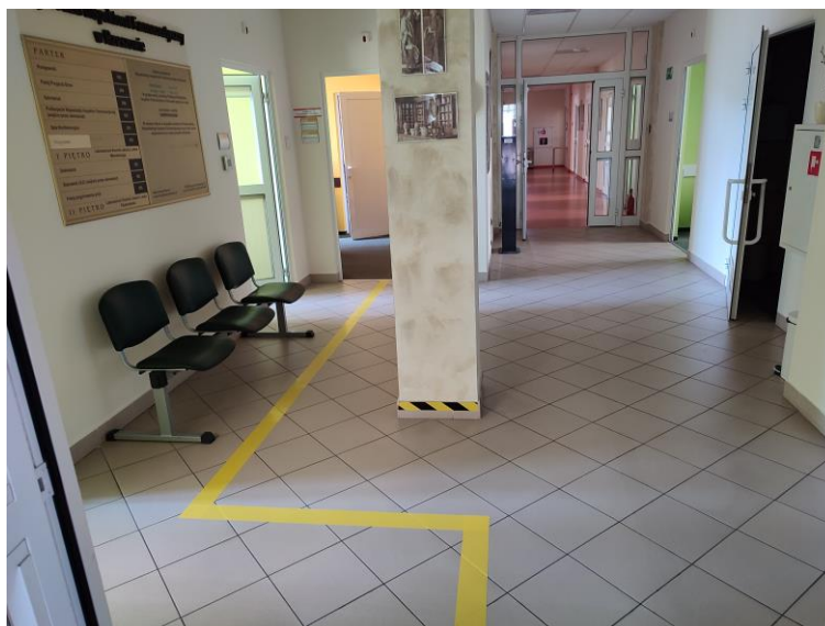
Zdjęcie 6: Oznakowanie podłogi w holu

W budynku znajduje się oznakowana widna umożliwiająca osobom poruszającym się na wózkach na przemieszczanie się pomiędzy kondygnacjami.