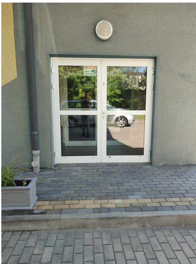
Zdjęcie 4: Wyjście ewakuacyjne

Dojście do budynku jest przestronne o płaskiej nawierzchni pozbawionej schodów. Wejście główne jest dobrze oświetlone światłem naturalnym, wspomaganym światłem sztucznym, gdy zaistnieje taka potrzeba. Drugie drzwi wejściowe obok wejścia głównego pozwalają na łatwy dostęp dla osób z trudnościami w poruszaniu oraz poruszających się na wózkach ponieważ dojście jest płaskie, bez barier, wprost do szerokiej windy. Przy drzwiach zamontowano dzwonek sygnalizujący potrzebę wejścia do budynku osobie poruszającej się na wózku zamontowany na odpowiedniej wysokości. W budynku mile widziany jest pies asystujący/przewodnik. Budynek posiada także oznakowane wyjście ewakuacyjne.