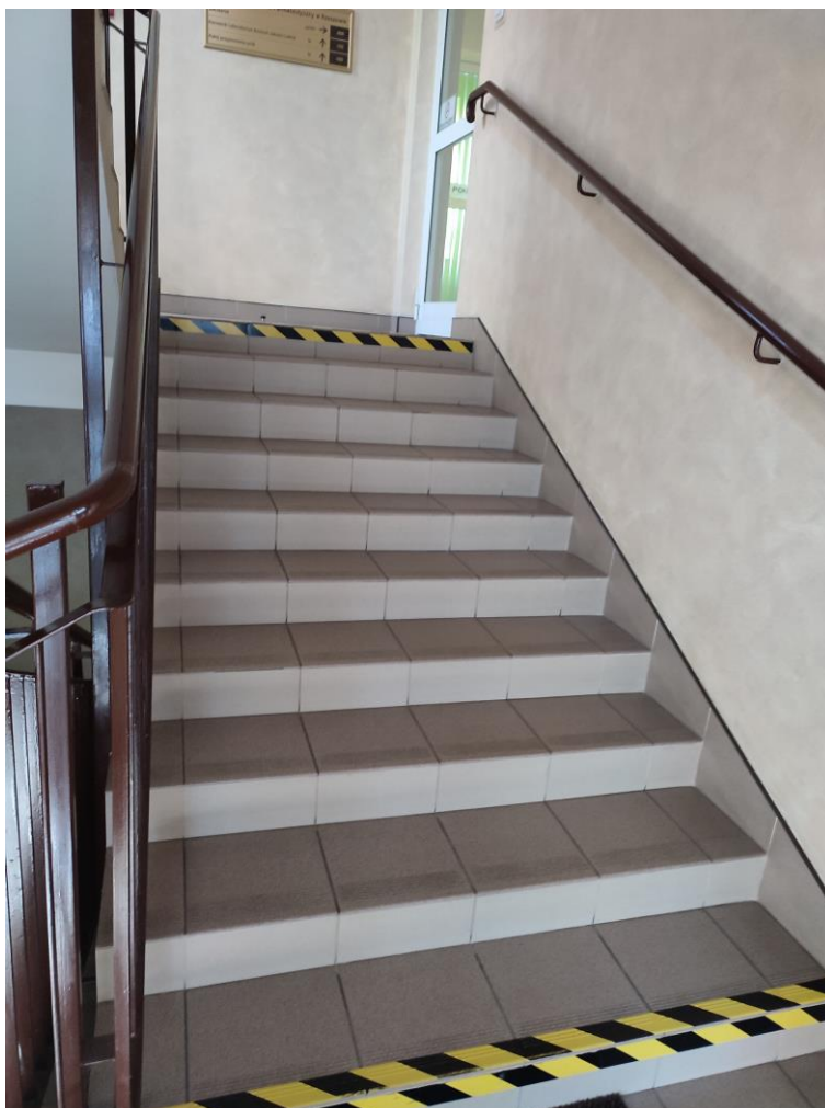
Zdjęcie 5: Oznakowanie schodów

Każdy ciąg schodów w budynku wyposażony jest w antypoślizgowe stopnice schodowe. Oznakowano je także czarno-żółtą taśmą samoprzylepną wyróżniając pierwszy i ostatni stopień. Po obu stronach schodów zamontowano poręcza ułatwiające poruszenie się po nich.