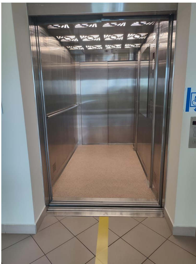
Zdjęcie 7: Winda

W budynku znajduje się oznakowana widna umożliwiająca osobom poruszającym się na wózkach na przemieszczanie się pomiędzy kondygnacjami.