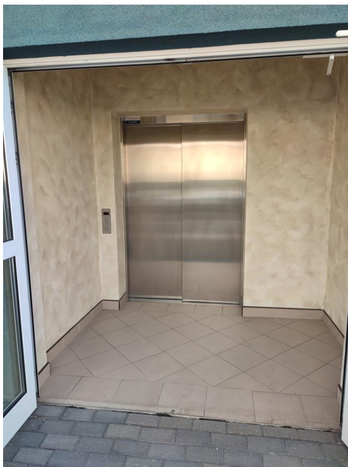
Zdjęcie 3: Wejście do budynku i winda