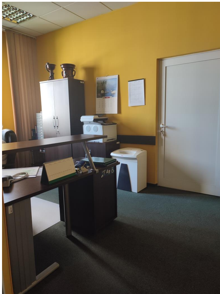
Zdjęcie 11: Sekretariat

Lada w recepcji przynajmniej na odcinku o szerokości 90 cm powinna znajdować się nie wyżej niż 90 cm od posadzki z zachowaniem możliwości podjazdu wózkiem inwalidzkim. W przypadku sekretariatu badanego podmiotu podwójna lada pozwala na komfortowy dostęp osobie siedzącej na wózku i jej długość wynosi 162 cm a wysokość 72 cm.